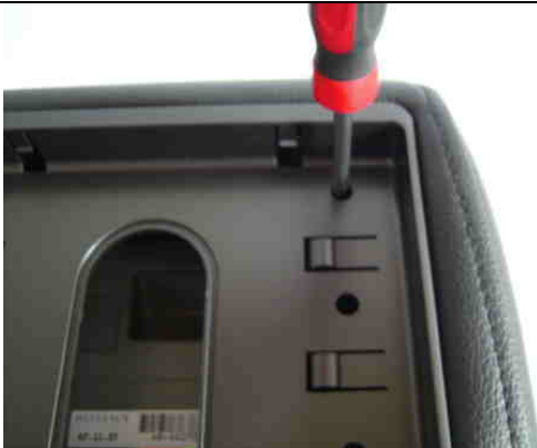
8 HKA 070 4x anschrauben