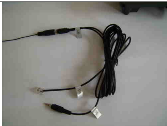
Klinke (schwarz) > DVB-T und DVD-Steuerung