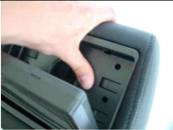
7 HKA070 fest andrücken